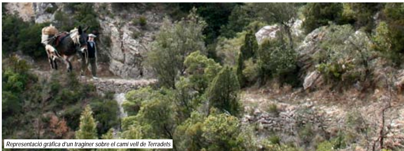
Representació gràfica d'un traginer sobre el camí vell de Terradets

ramals cap el nord per arribar fins al segon esglaó del Montsec on es trobaven altres petites poblacions com Mallabecs. Una vegada reconquerit el territori per Arnau Mir de Tost, molt pocs continuarien utilitzant-lo, ja que era més còmode utilitzar el que venia de Camarasa o d'Àger on s'unien després de l'hostal del Doll, situat aproximadament en el quilòmetre 46 de la actual carretera a Tremp i Pobla de Segur. Aquest "nou camí" que seguia el curs del Noguera Pallaresa penetrava en el congost, enganxat a les parets a plom, amb arcs de pedra a les immediacions de la paret de les Bagasses (un s'imagina veure al natural els gravats que inspiraren a Gustau Doré,